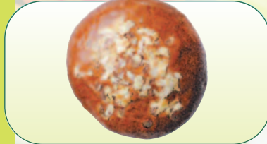
Mazanec máslový s mandlemi bal. 500 g