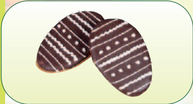
Medové vejce bal. 120 g