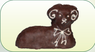
Beránek biskupský s tmavou pol. bal. 400 g