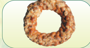
Velikonoční věnec s mandlemi bal. 400 g