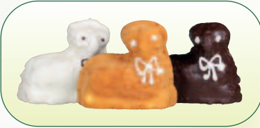
Beránek biskupský s bílou a tm. pol. bal. 150 g Beránek šlehaný bal. 80 g