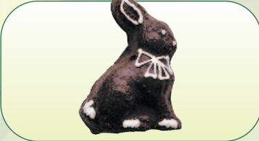
Zajíček biskupský bal. 300 g