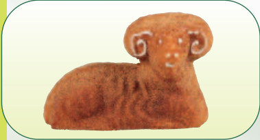
Beránek šlehaný bal. 350 g