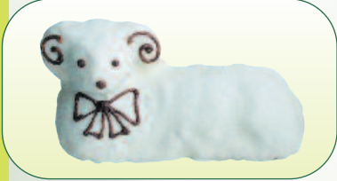
Beránek biskupský s bílou pol. bal. 450 g