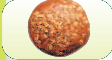
Mazanec tuk. s mandlemi bal. 460 g