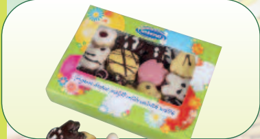
Velikonoční čajové pečivo bal. 300 g