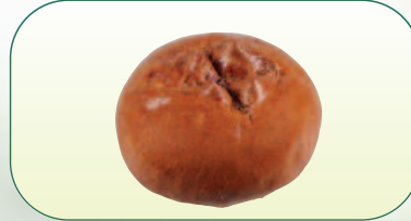
Mazanec s fruktózou bal. 200 g