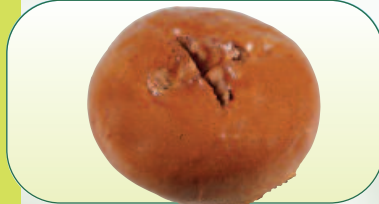
Mazanec s fruktózou bal. 400 g